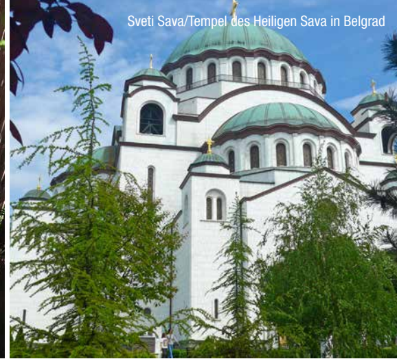
Sveti Sava/Tempel des Heiligen Sava in Belgrad