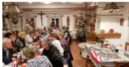
(Weihnachtsfeier am Nadlingerhof, 07.12.2018)