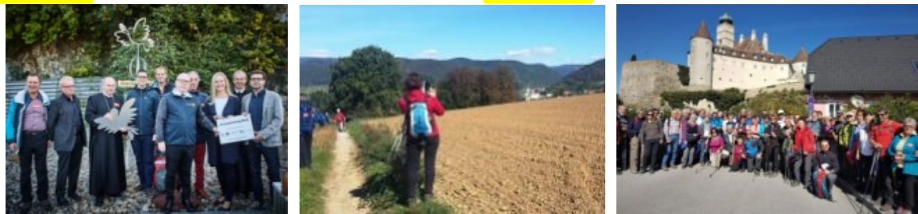
(Zum Öffnen auf die Vorschaubilder klicken)

Terminaviso 2019: Geplante Aufstellung der Friedenstaube in SPITZ / DONAU: SO. 14.04.2019 nach der Hl. Messe