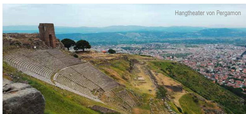
Hangtheater von Pergamon