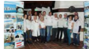
(click on the picture to open the link)

On December 21 st , 2013 we officially founded the JERUSALEM WAY International Peace Team as a peace club / NPO. What a special date – the winter solstice – and exactly a year before we initiated the beginning of the Jerusalem Way in Finisterra, Spain – at that point where the Way of St. James ends. See picture and YouTube Video.