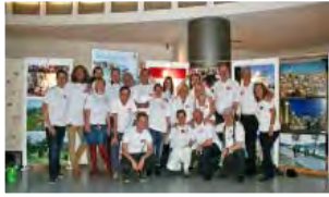
(click para ampliar)

La inauguración de la exposición de la paz de JERUSALEM WAY que tuvo lugar el 1 de abril 2014 en el parlamento de la Unión Europea en Bruselas fue un gran éxito. Miles de visitantes acudieron a la exposición internacional durante 3 días.