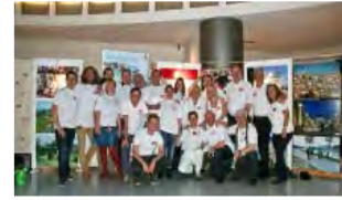
(Click on the picture to open the link)

The opening of the JERUSALEM WAY PEACE EXHIBITION on April 1 st , 2014 was a great success. Thousands of visitors were able to see the international exhibition.